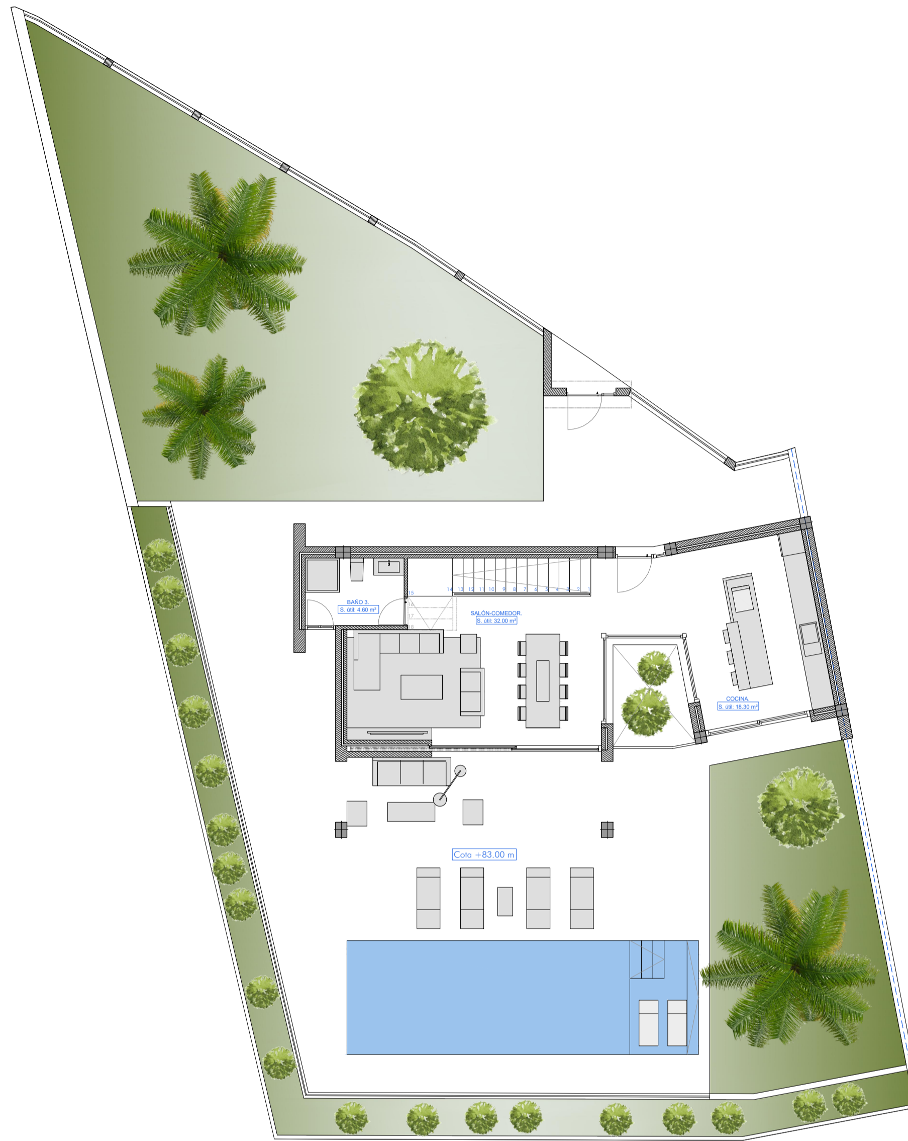
PLANTA BAJA: Superficie construida: 66.10 m 2