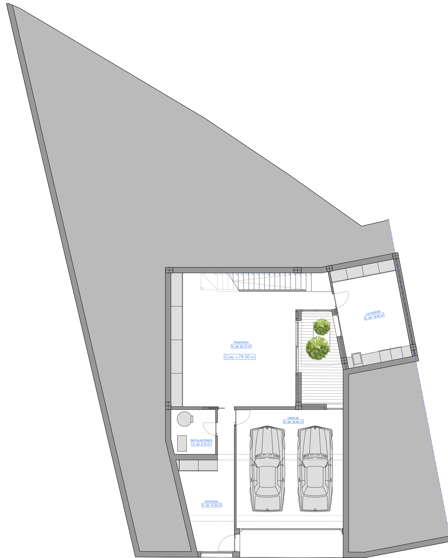
PLANTA SÓTANO: Superficie construida: 147.60 m 2