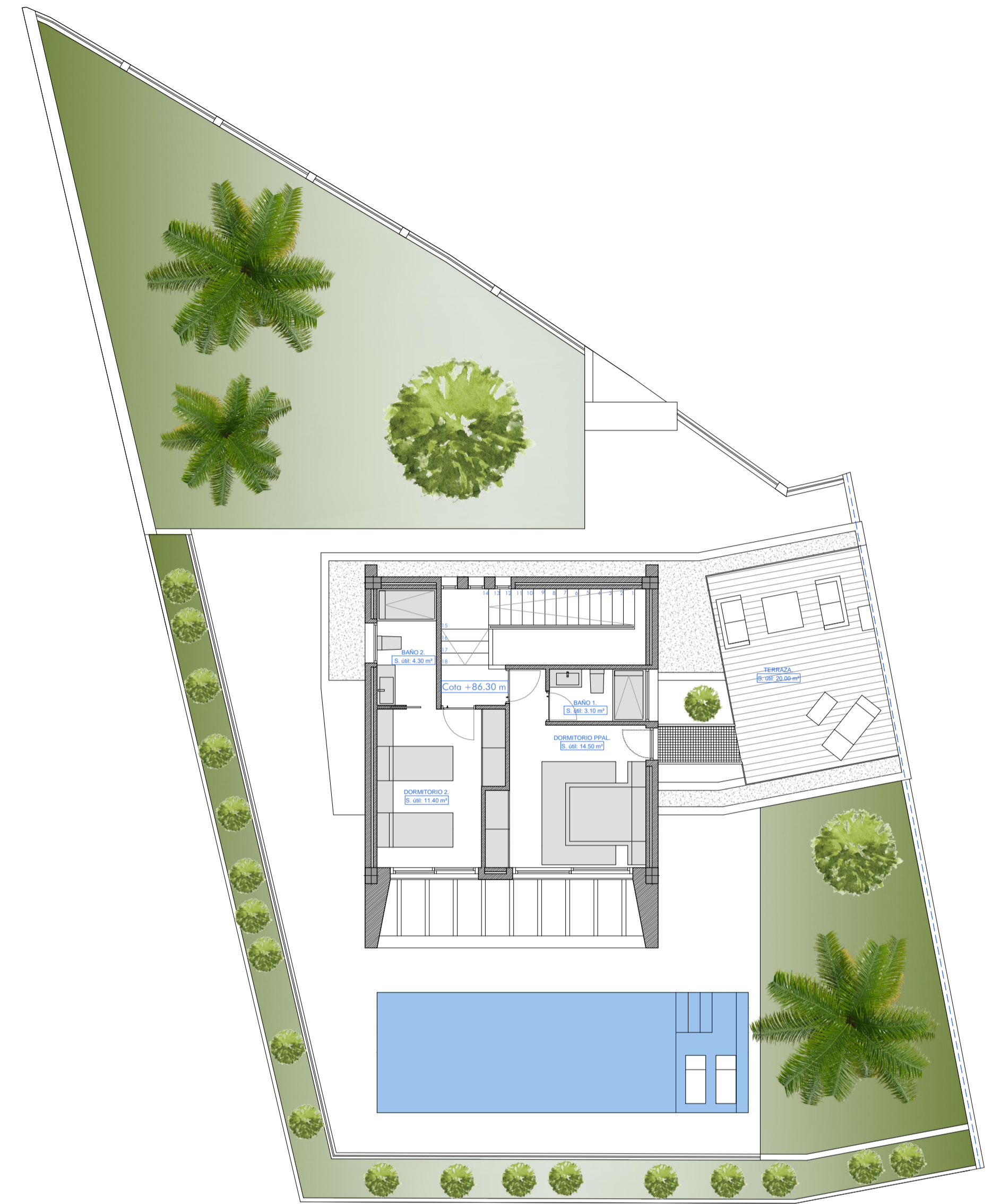
PLANTA PRIMERA: Superficie construida: 43.50 m 2