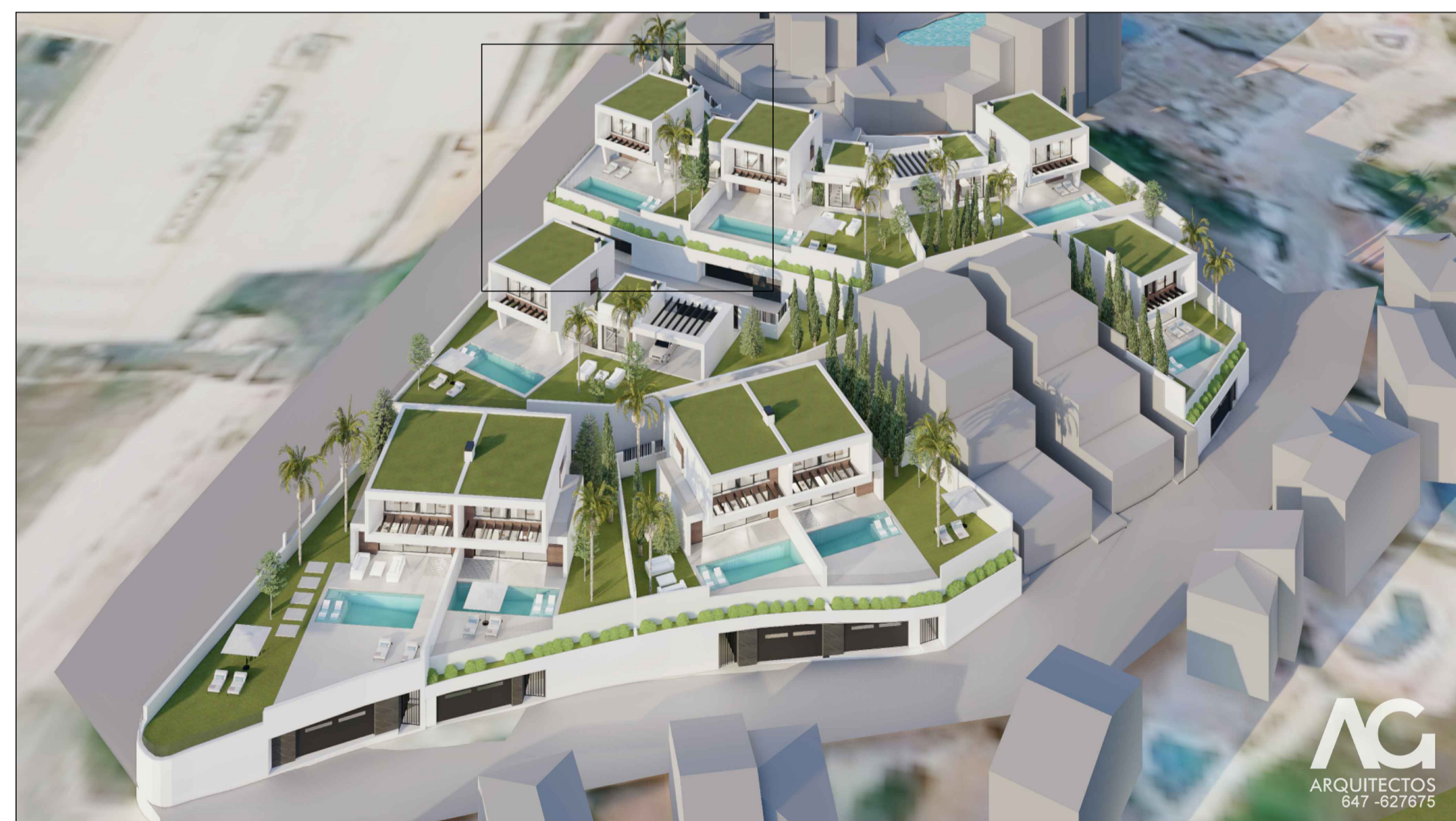
IMAGEN DE CONJUNTO.