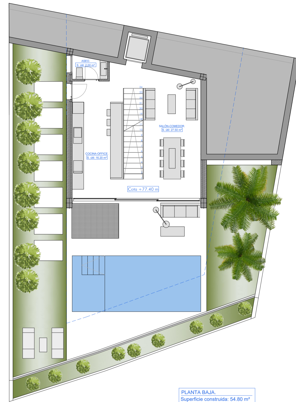
PLANTA BAJA Superficie construida: 54.80 m²