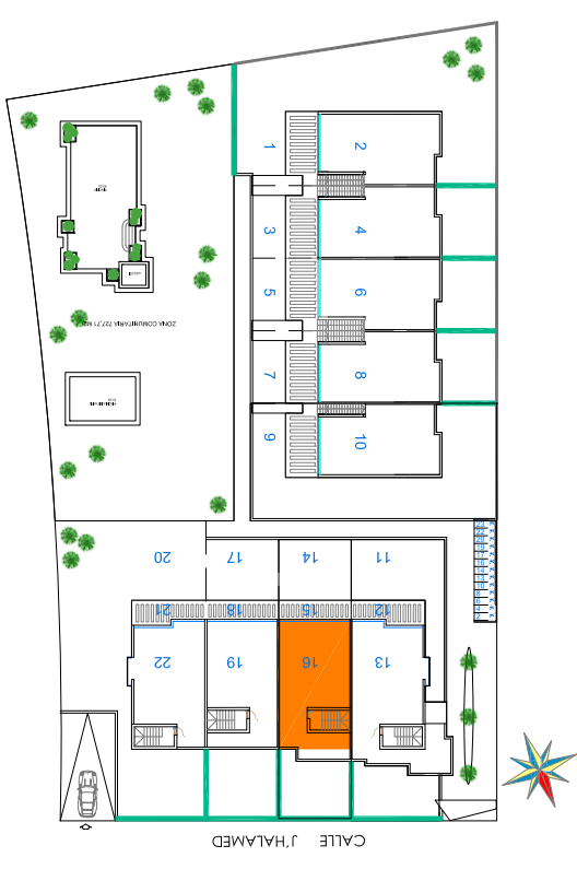
VIVIENDA ATICOS. 16-19