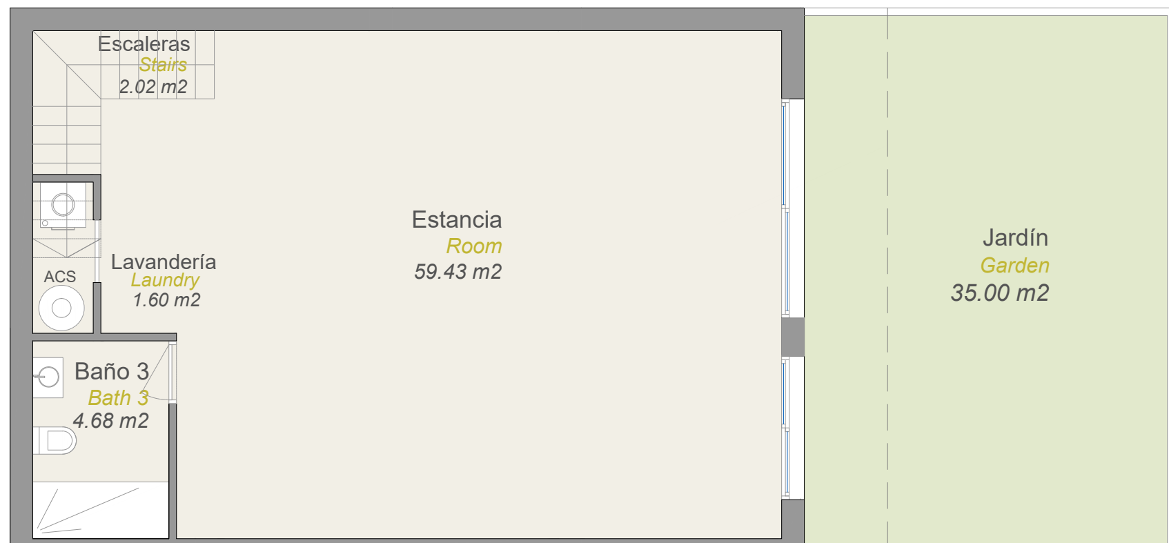
PLANTA BAJO RASANTE